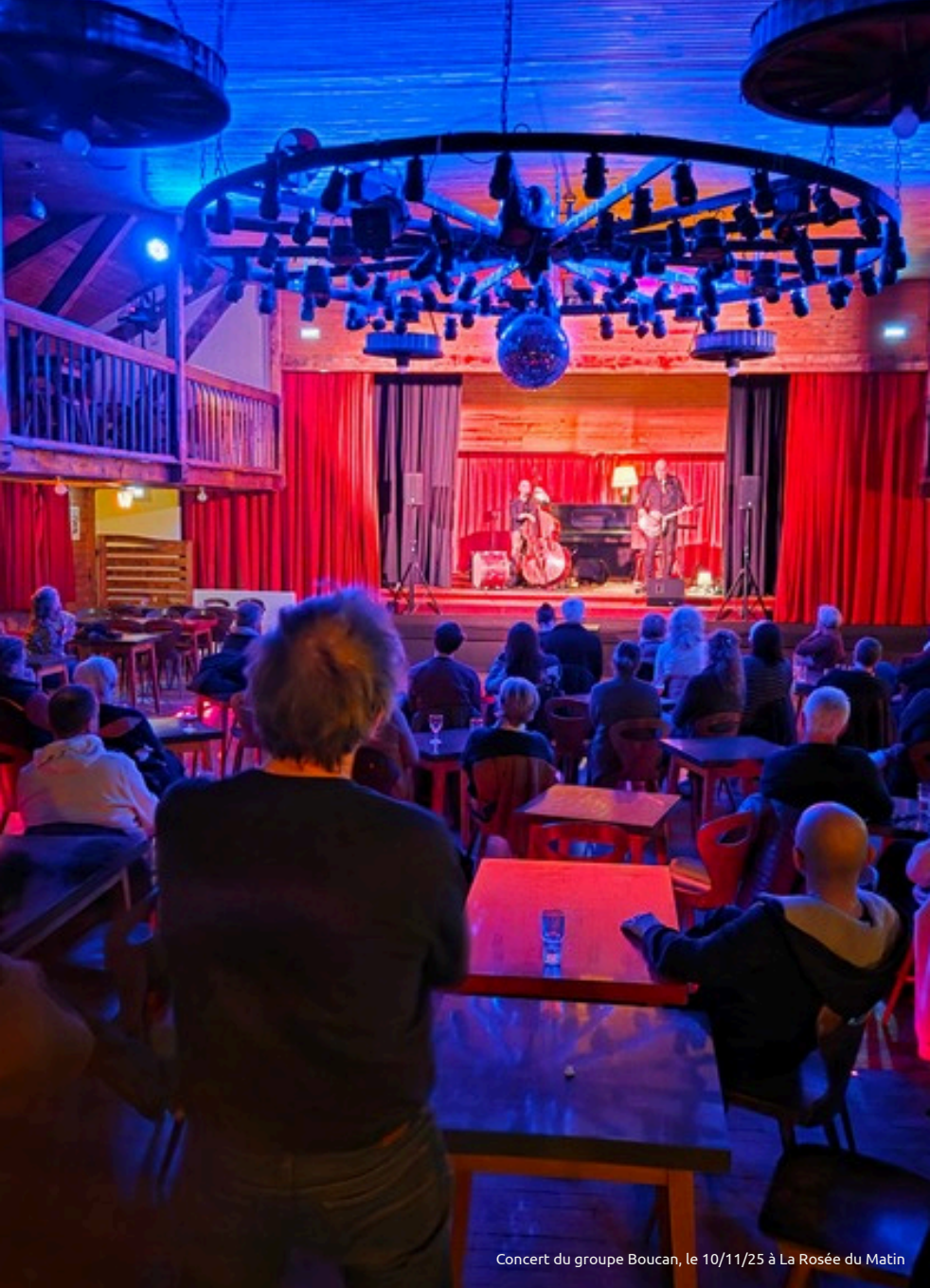
Concert du groupe Boucan, le 10/11/25 à La Rosée du Matin